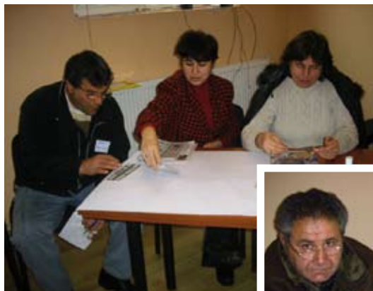
Партниране родители – учители, обучение прове- дено в Лом през Януари 2009

Необходимо е авторитетните напредничави личности в затворените ромски общности да оказват влияние върху тези традиции, за да се преодолее проблемът с ранните бракове. Необходимо е да се създават гъвкави механизми за продължаване на образованието от тези момичета и момчета, които на по-късна възраст са осъзнали необходимостта от образование. За сега в България единствената възможност остава самостоятелната форма на образование, която не предлага реални възможности за тези момичета и момчета да придобият необходимите знания за завършване на образователна степен.